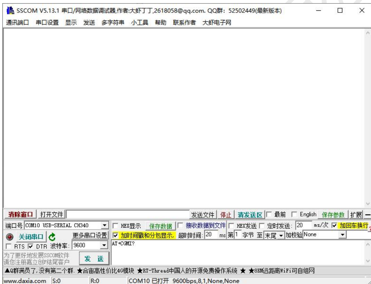
图 2：电脑端串口软件图

电脑端测试软件请在资料包中下载安装 sscom5.13.1 电脑串口软件进行测试，串口软件界面如下图：